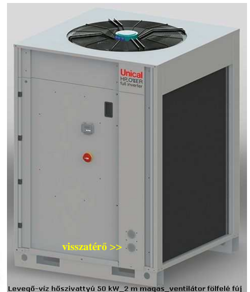
Levegő-víz hőszivattyú 50 kW _ 2 m magas _ ventilátor fölfelé fúj