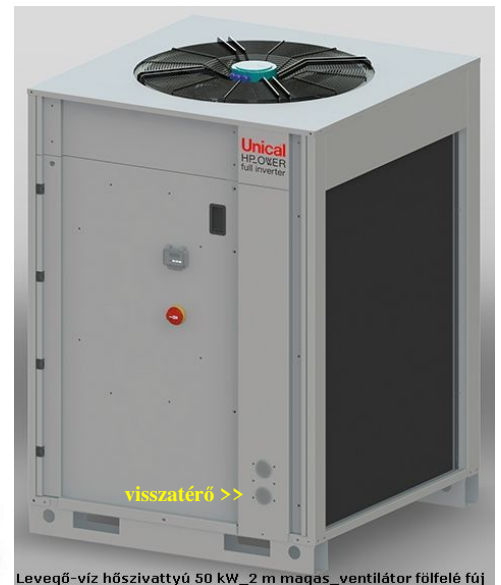
Levegő-víz hőszivattyú 50 kW _2 m magas _ventilátor fölfelé fúj